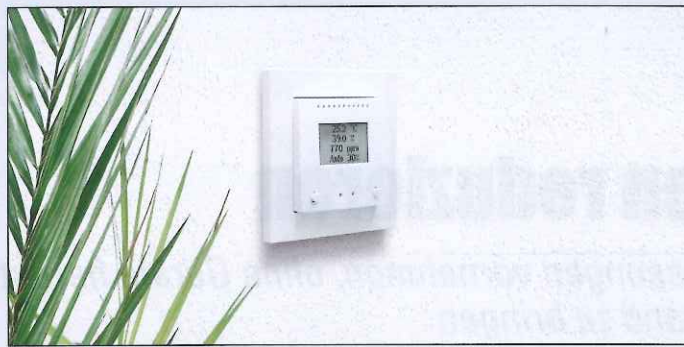
Der AQS/TH PF-U ist ein Sensor mit Lüftungsfunktion für die konventionelle Installation

zentralen Steuerungssysteme WS1 und WS1000 gibt es den Kombisensor WG AQS/TH-UP, der Temperatur, Luftfeuchtigkeit und CO 2 erfasst. Er kommuniziert per Funk mit der Zentrale, sodass er auch nachträglich noch installiert werden kann. Mit dem Sensor kann die Lüftung bei zu hoher CO 2 -Konzentration gestartet werden. Die Systeme WS1 und WS1000 sind als Designvarianten Color oder Style erhältlich. Die Steuerungen mit nutzerfreundlichem Touch-Display werden für die Beschattung, Belüftung, Lichtsteuerung und Temperaturregelung in Gebäuden und Wintergärten eingesetzt. Ist im Gebäude ein Bus-System wie KNX vorhanden, kann ein CO 2 -Sensor seine Daten parallel für verschiedene Zwecke bereitstellen: Für die automatische Lüftung, als Lüftungs-